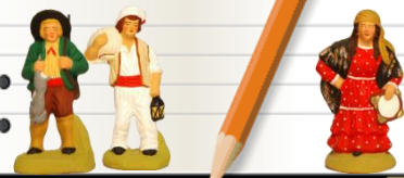
Marché de Noël

➤ Semaine du 12 décembre : Spectacle de Noël des enfants.